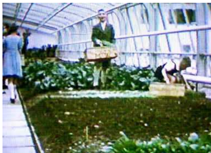
Los hijos de Martin Bormann en 1940 recogiendo vegetales en el invernadero de Adolf Hitler en Berchtesgaden