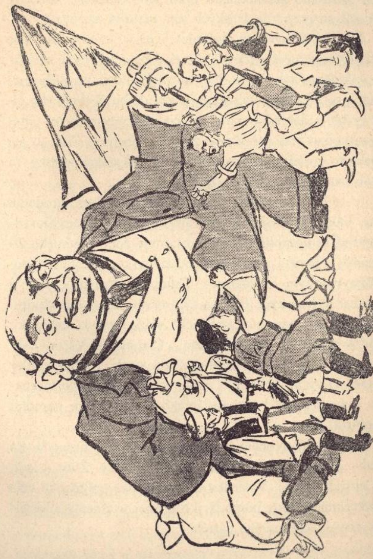
Všetkých proti všetkým hucká, aby mal vždy plné vrecká.

Po utvorení nezávislého slovenského štátu úrady vyme-