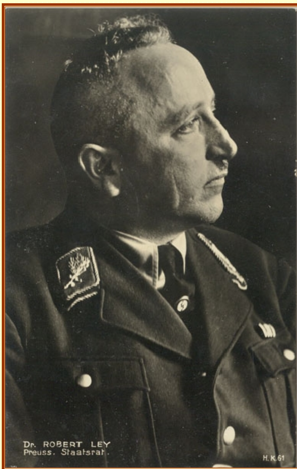
Райхслайтер, доктор Роберт Лай (15.02.1890 - 24.10.1945 г.)