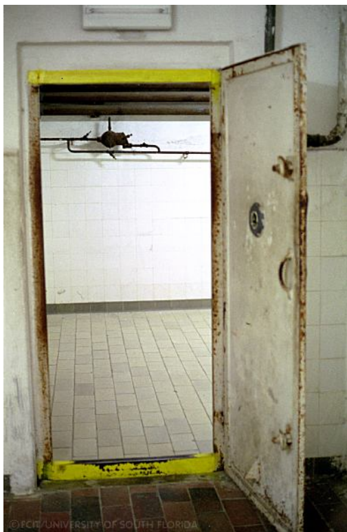
Gāzes kamera Dahau koncentrācijas nometnē.

Pievērsiet uzmanību uz to, ka vietā, kur durvis saduras ar sienu nav nekāda gumijas pārklājuma kā tas ir ASV gāzes kamerās. Dzelzs plāksnes nevar nodrošināt hermētismu. Šī telpa nevarēja būt par gāzes kameru jau apskatot tās durvis.