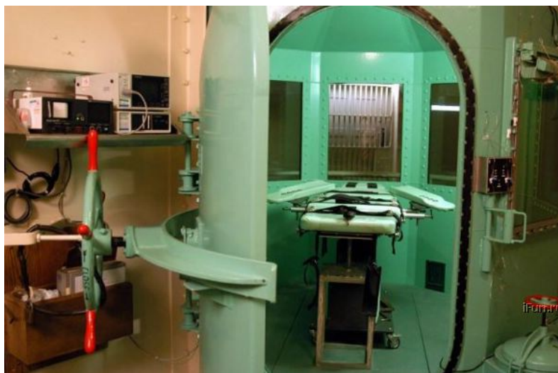
ASV cietuma San Kventin pagrabā esošā gāzes kamera.

Pievērsiet uzmanību uz to, ka vietā, kur durvis saduras ar sienu nav nekāda gumijas pārklājuma kā tas ir ASV gāzes kamerās. Dzelzs plāksnes nevar nodrošināt hermētismu. Šī telpa nevarēja būt par gāzes kameru jau apskatot tās durvis.