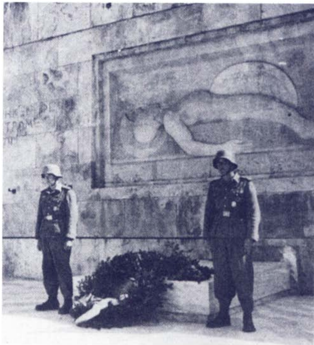
Αθήνα, 25 Μαρτίου 1943: Ο Γερμανικός Στρατός αποδίδει τιμές στο μνημείο του Αγνώστου Στρατιώτου, καταθέτοντας στεφάνι.