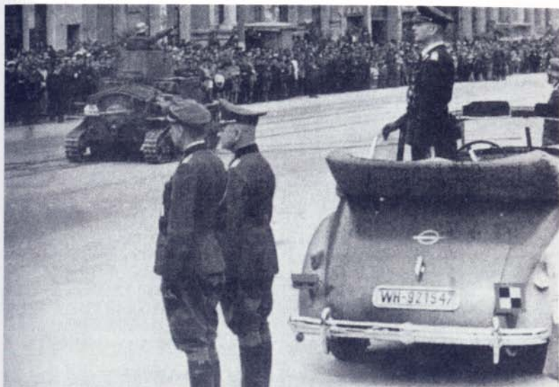
Ο Στρατιωτικός Διοικητής της Ελλάδος, πτέραρχος Σπάιντελ, επιθεωρεί παρελάνυνοντα τμήματα του Γερμανικού Στρατού στην Αθήνα.