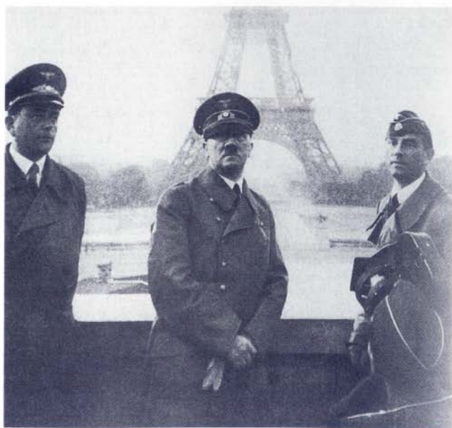
Ο Αδόλφος Χίτλερ με τον υπουργό-αρχιτέκτονα Α. Σπέερ και τον ελληνολάτρη γλύπτη Α. Μπρέκερ, το 1940, εμπρός από τον πύργο του Άιφελ.