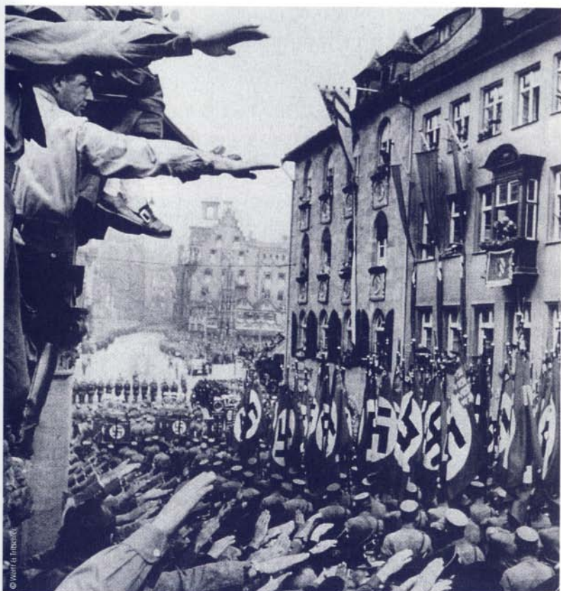
Διέλευση, κατά τη διάρκεια επιβλητικής παρελάσεως, των Ταγμάτων Εφόδου.