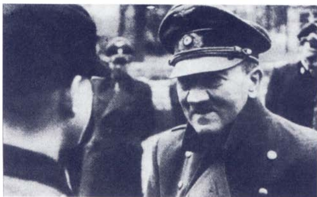
Βερολίνο, Απρίλιος 1945: Ο Αδόλφος Χίτλερ ελιθεωρεί τους έσχατους μαχητές της HitlerJugend.