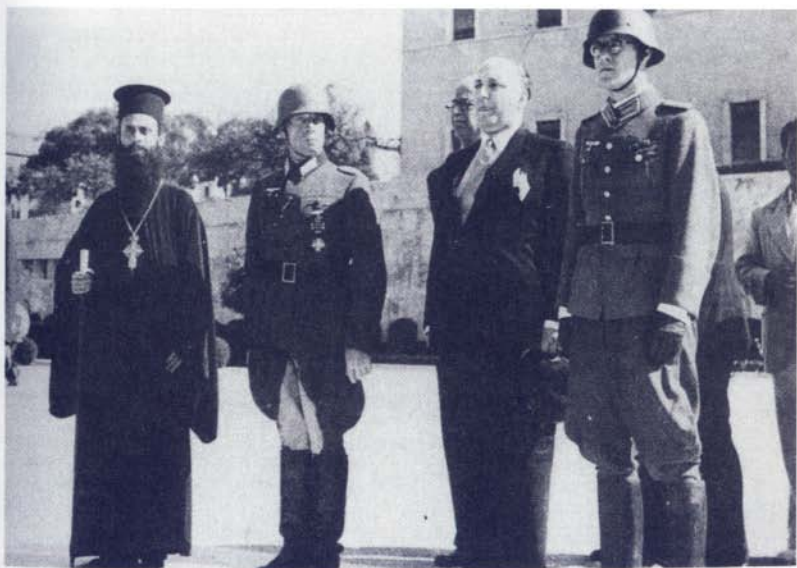
Από την τελετή αποχωρήσεως των γερμανικών στρατευμάτων από την Αθήνα, Οκτώβριος 1944.