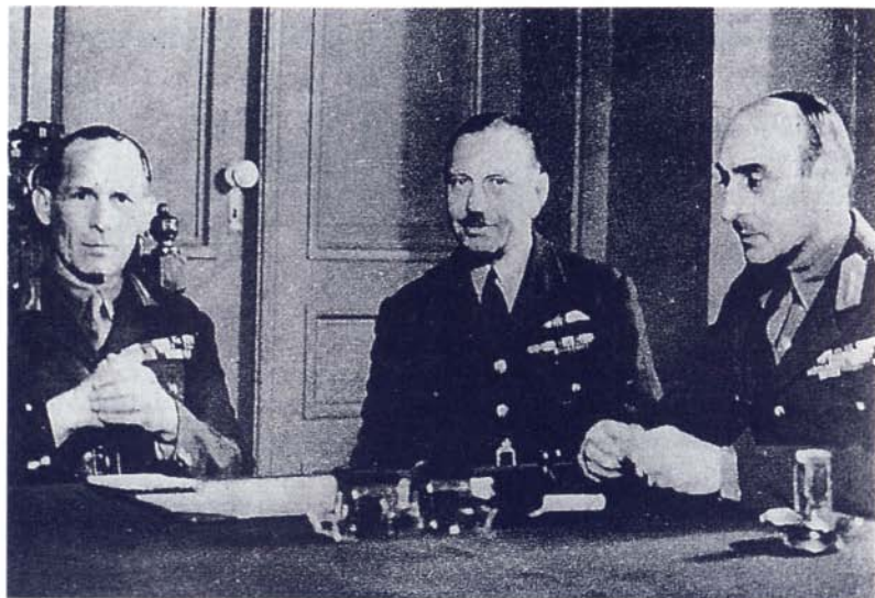
Πρωτοφανής δουλοπρέπεια: Σύσκεψη των Γεωργίου Β' και Παπάγου με άγγλο στρατιωτικό. Μετά τον θάνατο-δολοφονία του Μεταξά, η Ελλάδα υπήρξε προτεκτοράτο των Βρετανών...