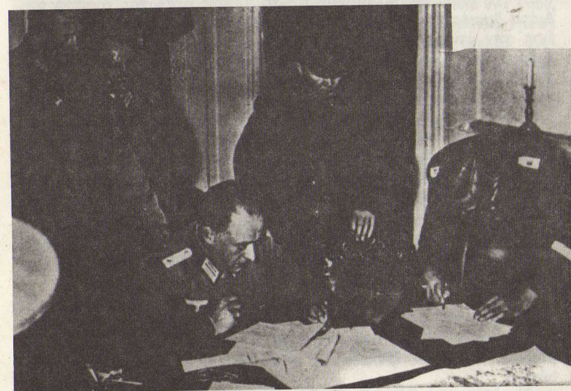
Τό Γερμανορωσικὸν σύμφωνο γιὰ τόν διαμελισμὸν τῆς Πολωνίας σὲ πλήρη ἐφαρμογή. Στὴν ἄνω φωτογραφία ἡ συνάντησις Ρώσων καὶ Γερμανῶν στὴν διαχωριστικὴ γραμμὴ. Στὴν κάτω φωτογραφία ἡ ἐπικύρωσις τοῦ διαμελισμοῦ.