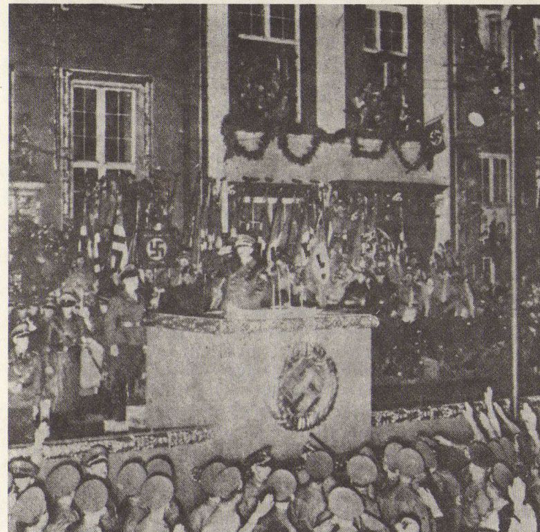
Ὁ Χίτλερ χαιρετᾷ τὰ πλήθη στό Δάντσικ.

Τὴν στιγμὴν αὐτὴν ἐχομεν 300 000 Πολωνούς στρατιώτας αἰχμαλώτους, περὶ τὰς 2000 ἀξιωματικούς καὶ ἀρκετοὺς στρατηγούς.