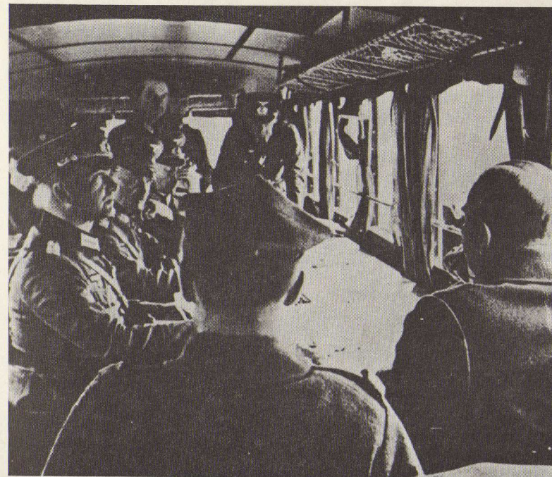
Οἱ Πολωνοὶ ἀξιωματικοὶ συζητοῦν τοὺς ὅρους τῆς συνθηκολογήσεως μέ τόν στρατηγὸ Μπλάσκοβιτς.

Ἡ Πολωνία ἐξέλεξε τόν πόλεμον καί τόν ἔλαβεν. Ἐξέλεξε τόν πόλεμον αὐτόν μέ ἐλαφράν καρδίαν διότι μερικοὶ πολιτικοὶ τῆς δύσεως τήν ἔπεισαν ὅτι γνωρίζουν πολὺ καλά τήν ποταπότητα τοῦ γερμανικοῦ στρατοῦ, τόν αἰσχρόν του ὀπλισμόν καί τήν κακὴν ἠθικὴν τῶν στρατευμάτων, τήν πτώσιν τῆς διαθέσεως εἰς τό ἐσω- τερικόν τοῦ κράτους καί τήν ἀπόστασιν ἡ ὁποία ὑπάρχει μεταξύ τοῦ Γερμανικοῦ λαοῦ καί τῆς κυβερνήσεώς του. Ἐπεισαν τοὺς Πολωνούς ὅτι θά ἦτο πολὺ εὐκόλον εἰς αὐτοὺς ὄχι μόνον νά ἀντι- σταθοῦν ἀλλὰ καί νά ἀποκρούσουν τόν στρατόν μας. Ἐπὶ τῇ βάσει τούτων ἔκαμε, ἡ Πολωνία, τό στρατηγικόν της σχέδιον τῇ συμπράξει στρατηγῶν τοῦ ἐπιτελείου τῆς δύσεως.