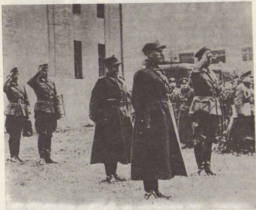
Ἡ κατάληψις τῆς Πολωνίας εἶναι γεγονός. Στὶς 27 Σεπτεμβρίου τοῦ 1939 παραδίδεται ἡ Βαρσοβία. Ἡ φωτογραφία ἀπὸ τὴν στιγμή τῆς παραδόσεως.

ἐπιστήση τὴν προσοχήν ἐπὶ τοῦ κινδύνου, τὸν ὁποῖον διατρέχομεν ὅταν δὲν γνωρίζομεν ἂν οἱ κύριοι αὐτοὶ εἰς τὸ προσεχές μέλλον δὲν θὰ παρακάθηνται εἰς τὴν κυβέρνησιν.