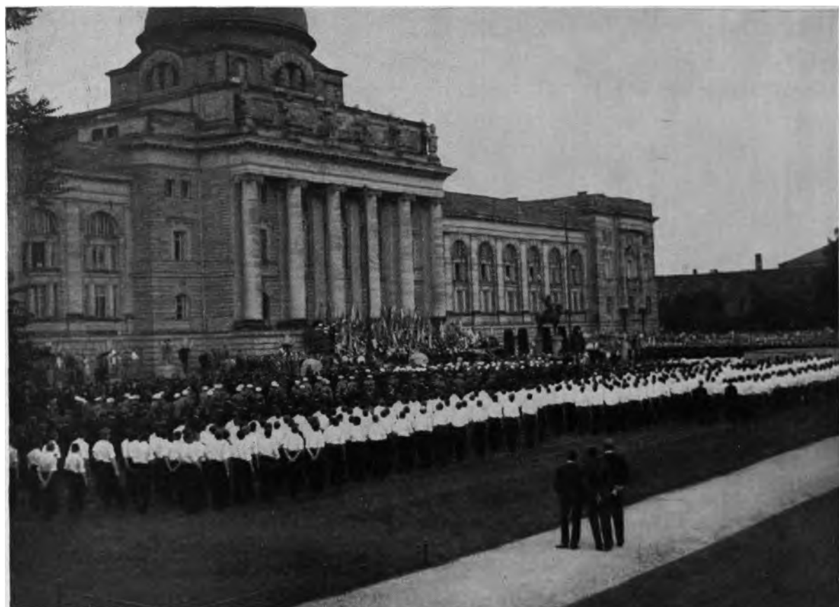
Der NSD.-Studentenbund München, während des Uniformverbotes, bei einer Protestkundgebung gegen den Schandvertrag von Versailles.