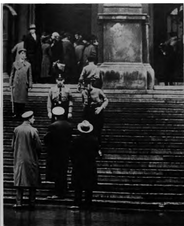
1931 Was ein Spaziergänger jetzt vor der Wiener Universität sieht! Bekanntlich war die Wiener Universität letzthin der Schauplatz großer antisemitischer Unruhen. Gegenwärtig ist das Gebäude von nationalsozialistischen Studenten bewacht, an denen jeder Eintretende passieren muß. Bild zeigt den Haupteingang zur Wiener Universität, aufgenommen am 16. November 1931....