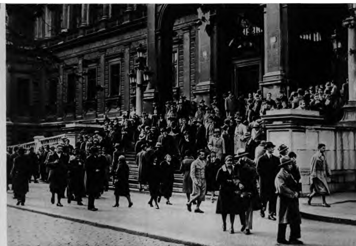
„Die nationalsozialistischen Studenten in Wien kündigen neue Kämpfe an, da das neue Studentenrecht in der nächsten Zeit im Parlament beraten wird. Vor der Wiener Universität ist ein großes Wahlaufgebot postiert. Die Gegner der Nationalsozialisten haben sich beim Schottertor postiert.“