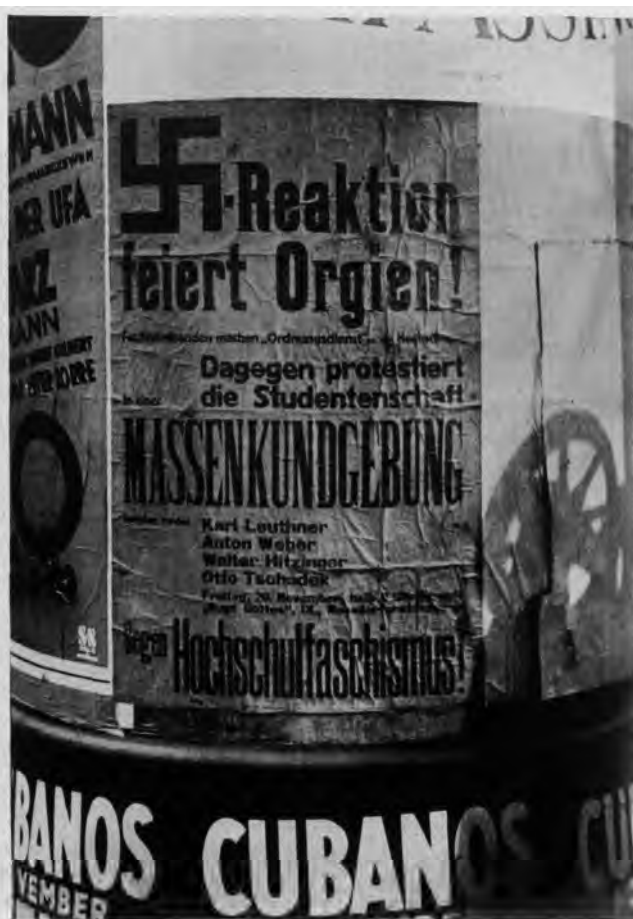
„Das Plakat der sozialistischen Studenten gegen die Nationalsozialistische Herrschaft auf der Wiener Universität.“