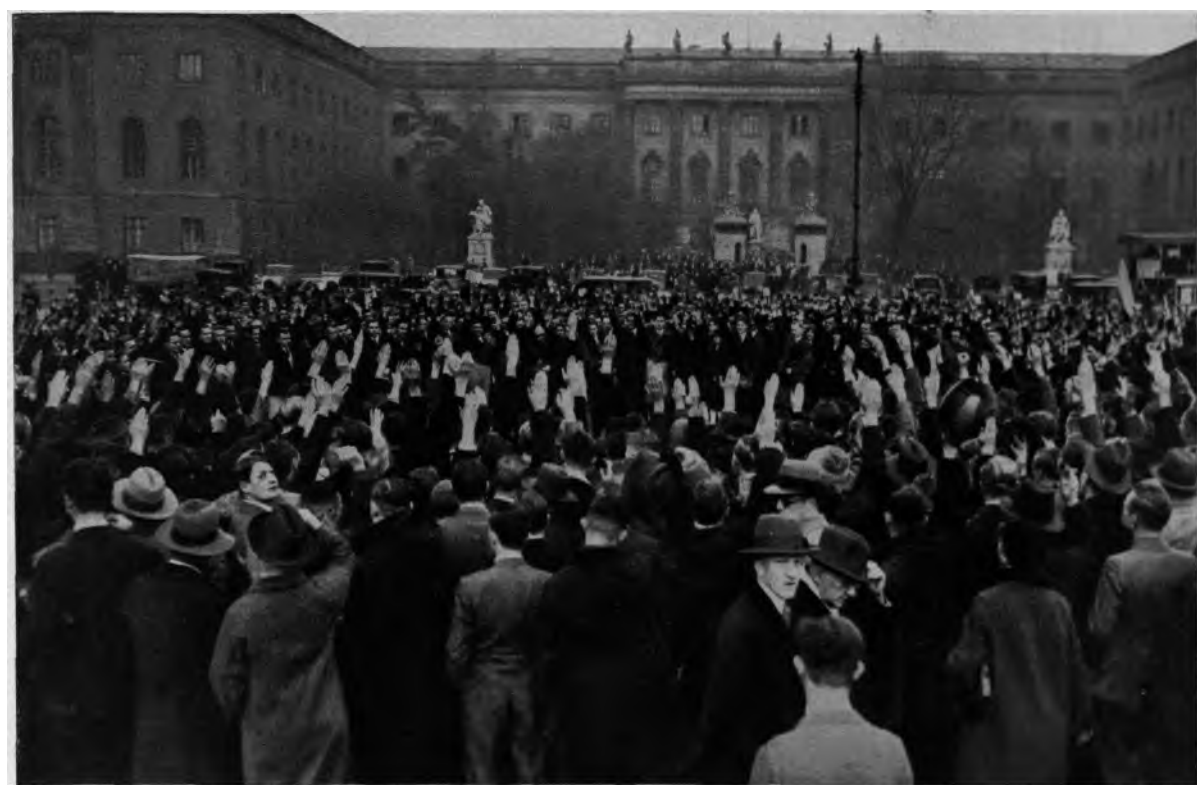
Studenten protestieren gegen fremden Terror in den Deutschland geraubten Gebieten (Universität Berlin).