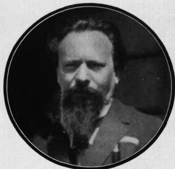
Dr. Theodor Lessing