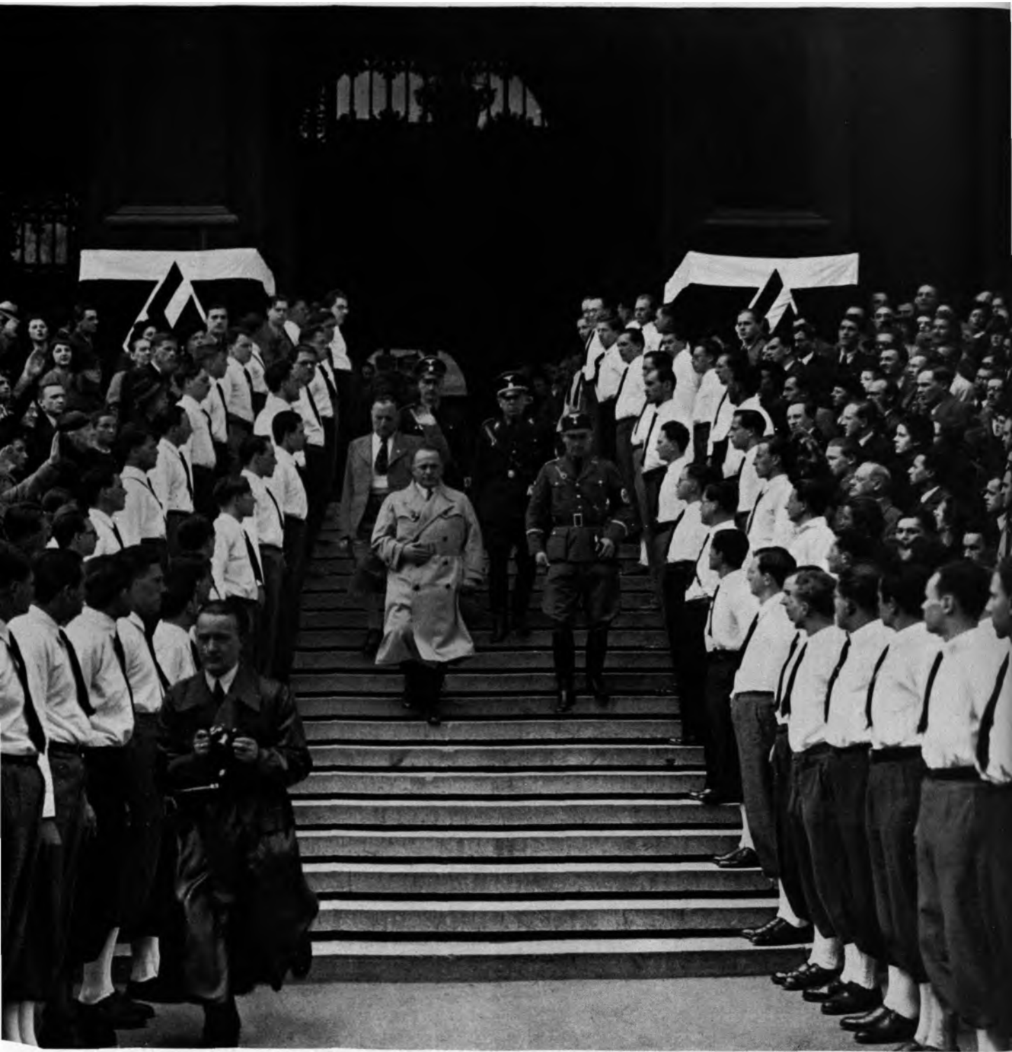
... Gauleiter Bürckel, Beauftragter des Führers für die Volksabstimmung in Österreich, und der stellvertretende Reichsstudentenführer, Pg. Gorn, verlassen nach der Rundgebung die Wiener Universität ....