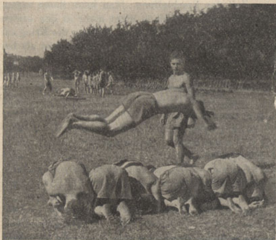
Männer der „Feldherrnhalle“ bei der Ausbildung.