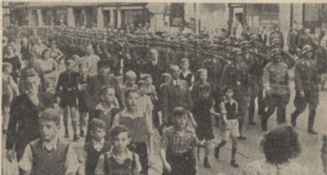
Der 2. Sturm des II. Sturmbannes marschiert in Chemnitz ein.

Auch die Mittagszeit des nächsten Tages wurde in einem Werk verbracht. Nach Geländeausbildung am Nachmittag fand ein Gemeinschaftsabend im Schützenhaus von Auersbach statt. Auf dem Programm des folgenden Tages in Lengenfeld stand Formalausbildung auf einem Sportplatz und ein Gemeinschaftsabend im Speisesaal einer Fabrik, zu dem 1800 Volksgenossen erschienen. Vom hochgelegenen Parkhotel blies der Spielmanszug den Zapfenstreich. Auf dem Marsch nach Reichenberg wurde ein KK.-Schießen durchgeführt. In der Tonhalle wurden die Männer vom Kreisleiter begrüßt. Am Kameradschaftsabend nahm die Orchesterschule von Reichenberg teil. Die jungen SA.-Männer der „Feldherrnhalle“ führten Hechtrollen, freie Übersläge und den Sprung durch den brennenden Reifen vor. Auch hier fanden die Vorführungen und Erklärungen eines Fallschirmes besonderes Interesse. Am nächsten Tage kehrte der Sturm nach Dresden zurück.