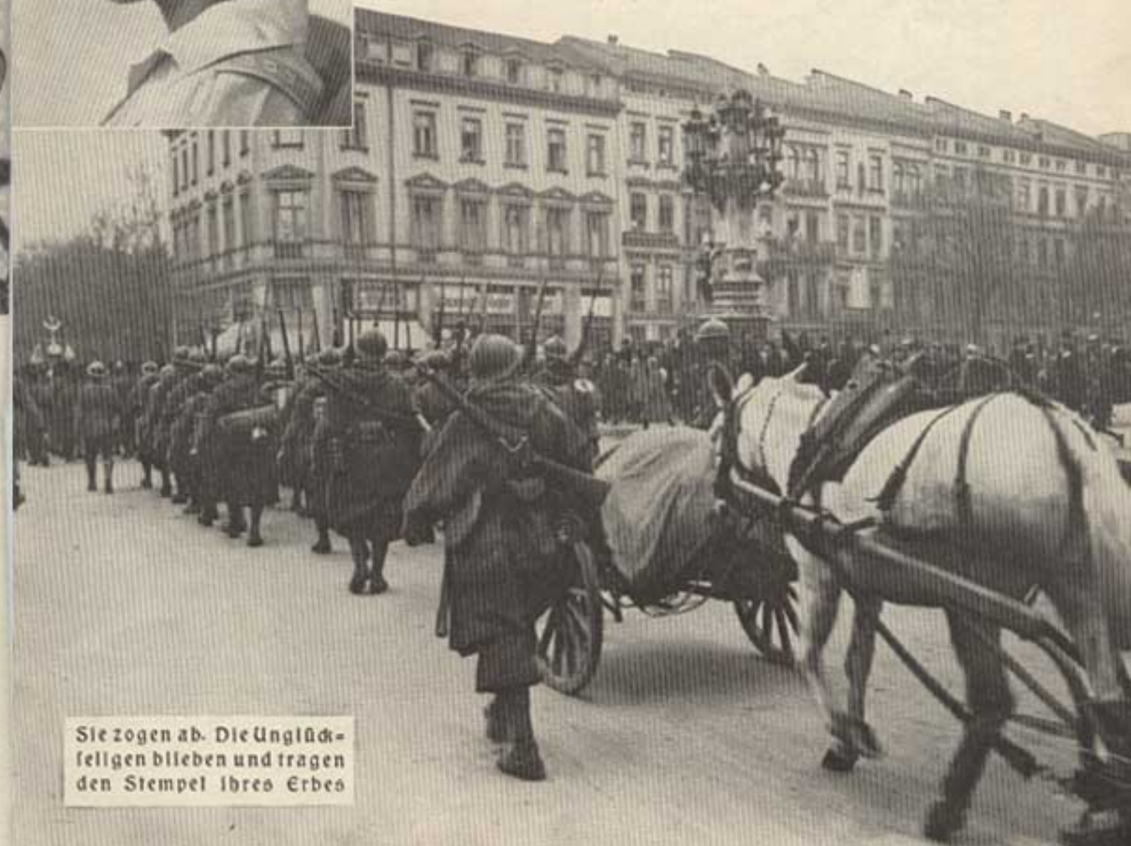
Sie zogen ab. Die Unglückseligen blieben und trugen den Stempel ihres Erbes