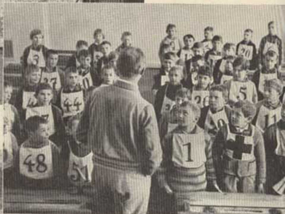
Unten: Theoretischer Unterricht