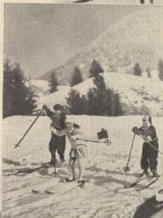
Wettfahrt der Reinften