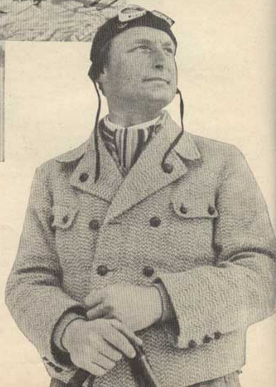
Der Herr Lehrer