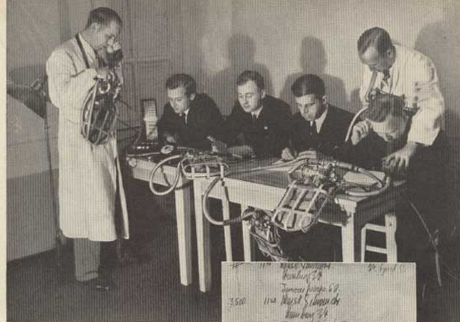
Links: Verständigung mit dem überwachenden Arzt Oben und rechts: An der Veränderung der Handschrift erkennt man den Beginn und den Grad der Höhenkrankheit