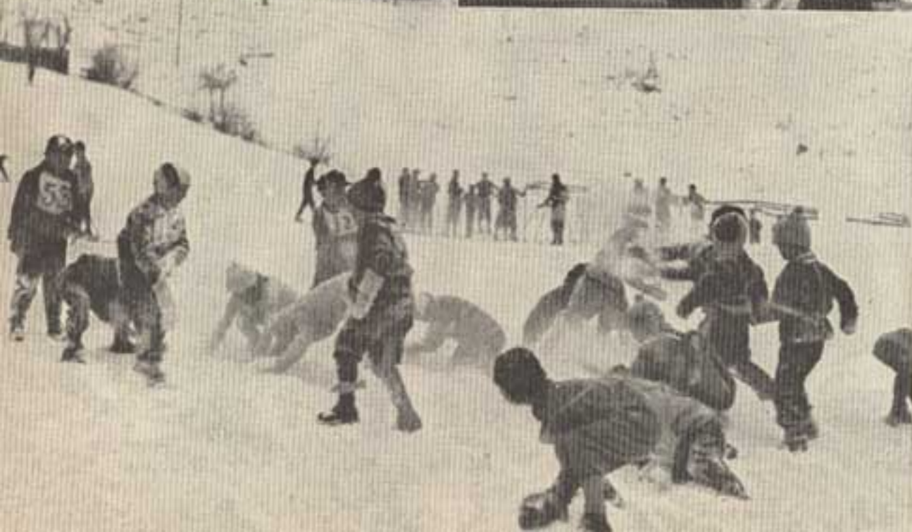
Eine Schneeballschlacht darf nicht fehlen