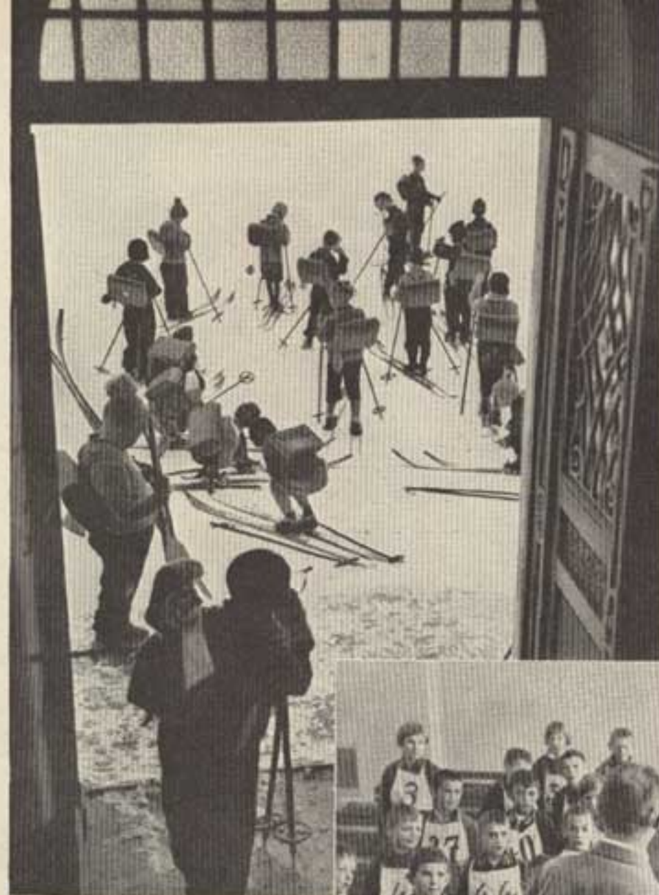
Der Unterricht ist aus