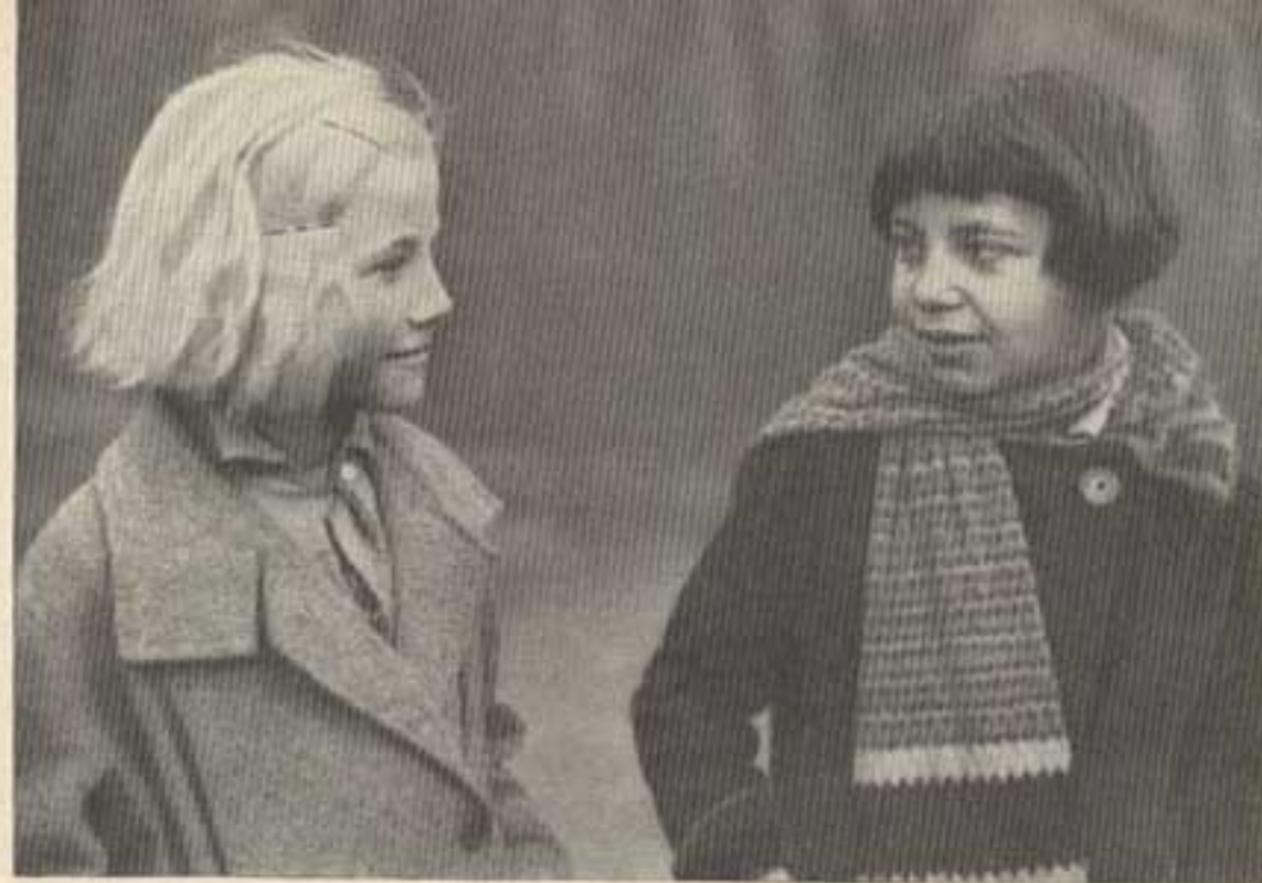
Links ein reinrassiges Mädchen aus dem Rheinland, rechts der Abkömmling eines Negers und einer weißen Mutter

daß sie bald zu der sozial am bedauernswertesten Schicht absteigen, weil auch der ärmste auf seine Rassenzugehörigkeit stolze Volksgenosse sich von ihnen als den Zeugen eines fluchwürdigen Geschehens absondert.