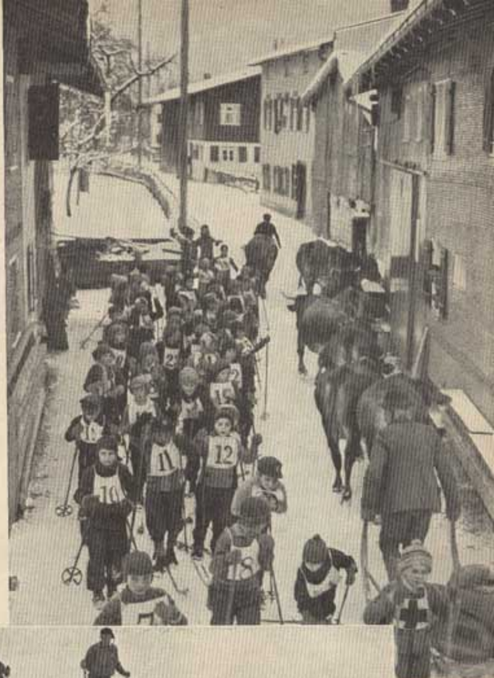
Rusmaria zum Canglauf