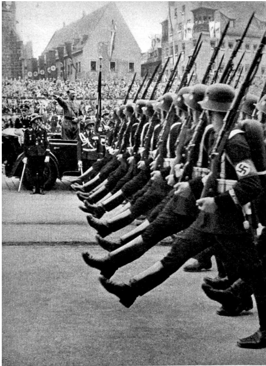
Vorbeimarsch der HJ vor dem Führer auf dem Reichsparteitag in Nürnberg