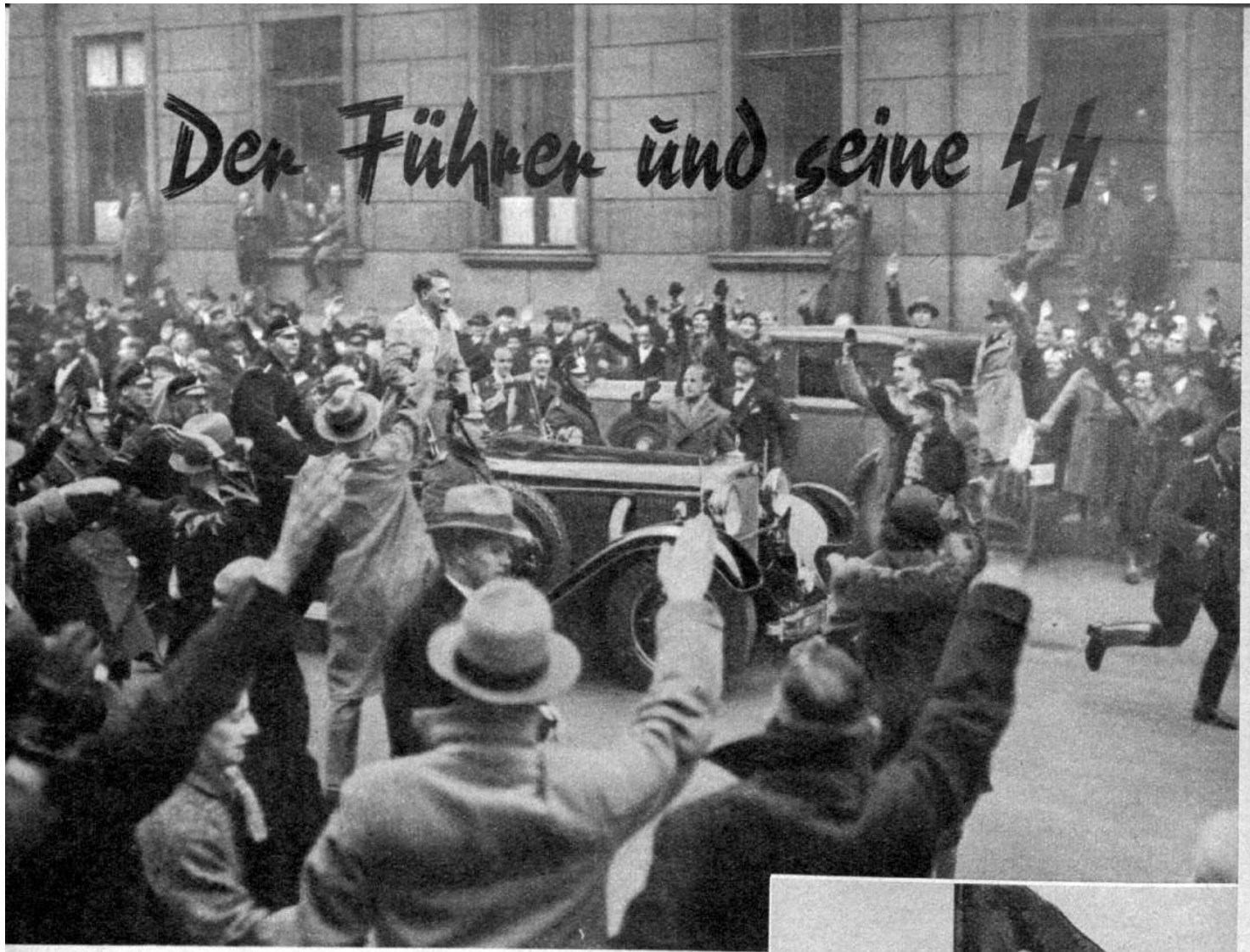
Der Führer durchfährt mit seinem SS-Begleithkommando die Berliner Wilhelmstraße kurz nach der Machtübernahme