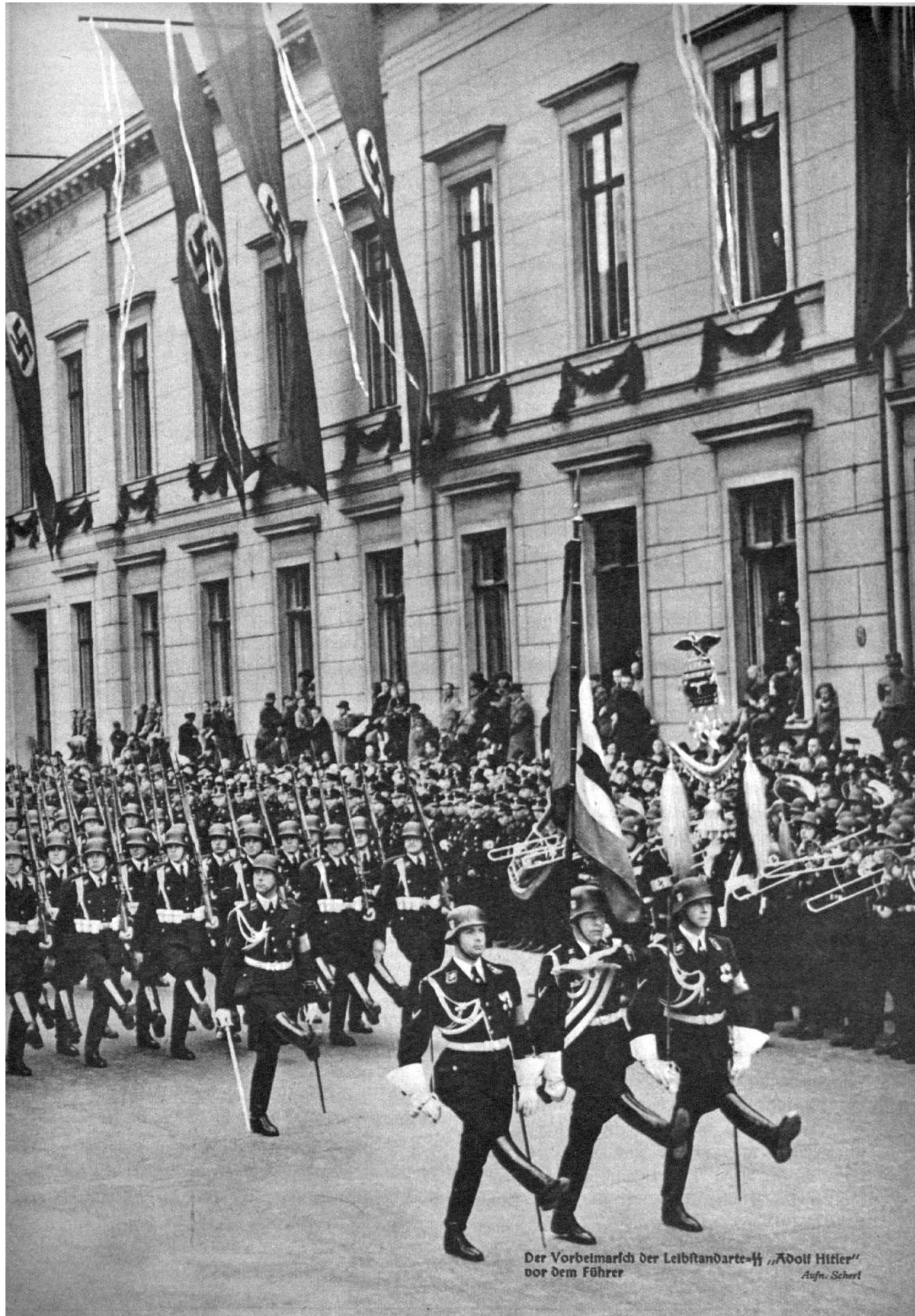
Der Vorbeimarsch der Leibstandarte-SS „Adolf Hitler“ vor dem Führer