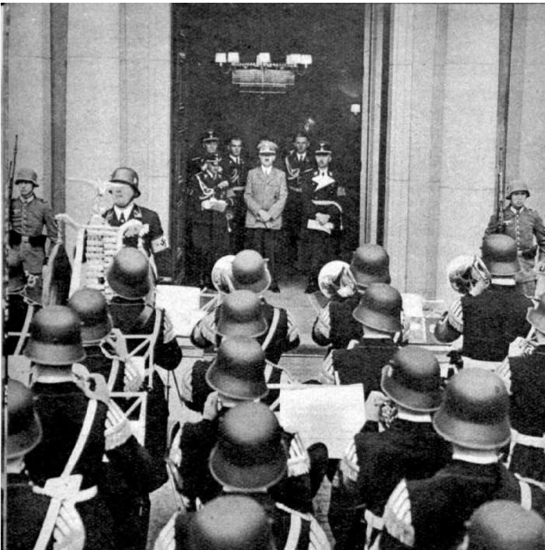
Am frühen Morgen des 50. Geburtstages erfreute das Musikkorps der Leibstandarte SS „Adolf Hitler“ den Führer mit dem traditionellen Morgenständchen

Die Dankbarkeit der SS fand ihren Ausdruck in dem Tagesbefehl des Reichsführers-SS und Chefs der Deutschen Polizei vom 20. April 1939 an alle Angehörigen der SS und der Deutschen Polizei: