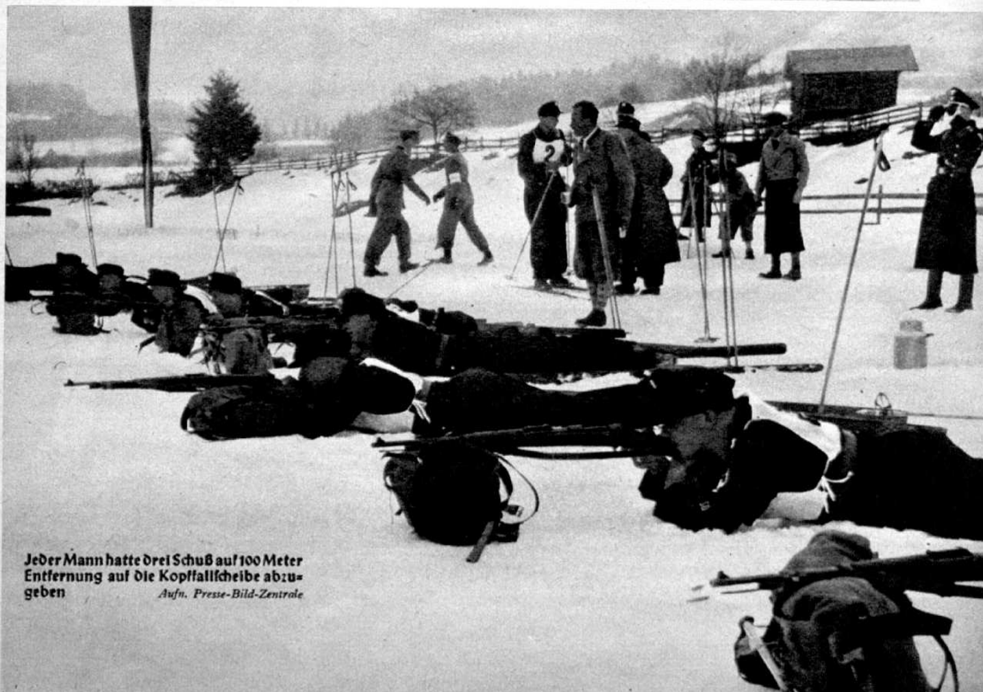
Jeder Mann hatte drei Schuß auf 100 Meter Entfernung auf die Kopffallscheibe abzugeben