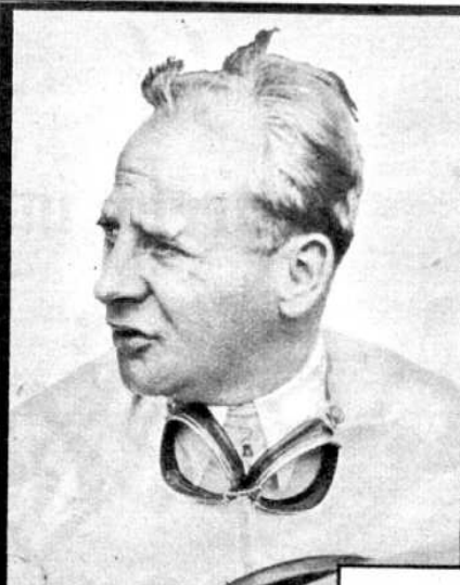
SS -Hauptsturmführer Kohlrauf

Die Bilder zeigen die 9 SS -Fahrer, denen das goldene Motorportabzei- chen verliehen wurde