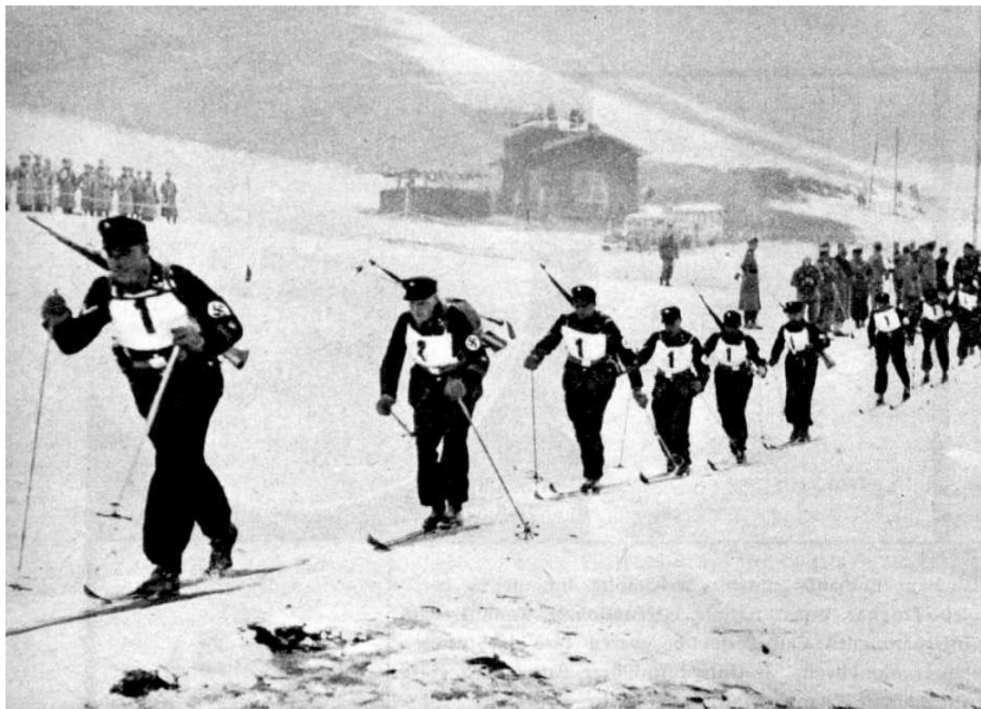
In langer Reihe gehen die Mannschaften auf die Strecke. Sämtliche Aufnahmen sind bei den Polizei-Skimeisterschaften in Kitzbühel aufgenommen.