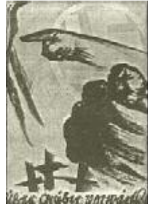
Über Gräber vorwärts Postkarte von Mjölneur

Selbstverständlich nahmen die marxistischen Parteien das nicht kampf- und widerspruchlos hin. Sie setzten sich dagegen zur Wehr, und da sie unserer scharf durchdachten, logischen politischen Beweisführung nichts an geistigen Argumenten entgegenzustellen hatten, mußten sie an die rohe Gewalt appellieren. Die Bewegung wurde von einem blutigen Terror bedroht, der bis zum heutigen Tage nicht nur nicht nachgelassen hat, sondern sich von Monat zu Monat und von Woche zu Woche verstärkt. Vor allem damals, als die Partei in Berlin noch klein und unansehnlich war, hatte die SA. als Trägerin des aktiven Kampfes unserer Bewegung Unerträgliches zu erdulden. Der SA.-Mann war schon damit, daß er das Braunhemd anzog, für die Öffentlichkeit zum politischen Freiwild gestempelt. Man schlug ihn auf den Straßen blutig und verfolgte ihn, wo er sich nur zu zeigen