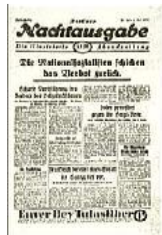
Die Berliner Presse zum Verbot der NSDAP.

Die nationalsozialistische Bewegung in Berlin hatte aufgehört, gesetzmäßig zu existieren. Das war ein Schlag, den wir nur schwer verwinden konnten. Wir hatten uns gegen die Anonymität und gegen den Terror der Straße durchgesetzt, wir hatten Idee und Fahne vorwärts getragen, ohne auf die Gefahren, die unser dabei warteten, zu achten. Wir hatten keine Mühe und Sorge gescheut, der Bevölkerung der Reichshauptstadt unseren guten Willen und die Redlichkeit unserer Ziele zu zeigen. Das war uns auch bis zu einem gewissen Umfang schon gelungen. Die Bewegung setzte eben an, ihre letzten parteipolitischen Fesseln abzustreifen und in die Reihe der großen Massenorganisationen einzurücken, da schlug man sie mit einem mechanischen Verbot zu Boden. Man ahnte allerdings damals nicht, daß auch dieses Verbot keineswegs die Bewegung endgültig vernichten, daß es im Gegenteil