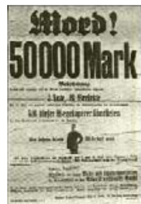
So arbeitet Rot-Mord! 2

Ein blinder Zufall wollte, daß in demselben Zug, der die SA. von Trebbin nach Lichterfelde-Ost transportieren sollte, größere Kommandos des Roten-Frontkämpfer-Bundes saßen, die von einer politischen Kundgebung in Leuna zurückkehrten. Die IA, die sonst immer so hurtig bei der Hand ist, wenn es gilt, Nationalsozialisten zu überwachen oder eine unserer politischen Reden nach Gesetzesverletzungen hin zu überprüfen, hatte sich der sträflichen Fahrlässigkeit schuldig gemacht, die extremsten politischen Gegner für eine nahezu einstündige Fahrt in einen gemeinsamen Zug hineinpfuschen zu lassen. Damit waren blutige Zusammenstöße bei der Hochspannung der politischen Atmosphäre in Berlin unvermeidlich geworden. Schon beim Besteigen des Zuges in