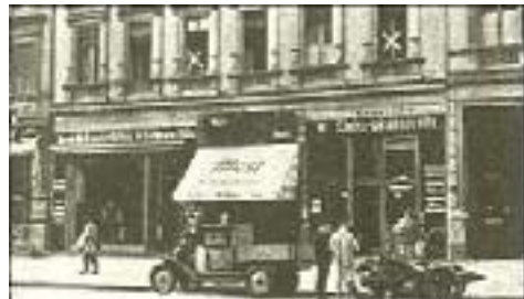
Lützowstraße 44 (XX): Zweite Geschäftsstelle der NSDAP. in Berlin

In den damaligen Wochen wurde auf einer Berliner Bühne mit großem Erfolg das Götzsche Schauspiel "Neidhard von Gneisenau" viele hundert Male zur Aufführung gebracht. Es war für mich das erste große Theatererlebnis in der Reichshauptstadt. Ein Satz jenes