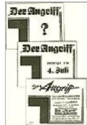
Wirksame Säulenreklame zum Erscheinen des "Angriff"

In der letzten Juniwoche erschienen an den Plakatsäulen in Berlin mysteriöse Anschläge, über die sich manch einer den Kopf zerbrach. Wir hatten unseren Plan so geheim wie möglich gehalten, und es war uns in der Tat gelungen, ihn den Augen der Öffentlichkeit gänzlich zu entziehen. Ein großes Erstaunen ging durch Berlin, als eines Morgens an den Litfaßsäulen auf blutroten Plakaten in lakonischer Kürze zu lesen stand: "Der Angriff" ! Man war betroffen, als ein paar Tage später ein zweites Plakat erschien, auf dem die mysteriöse Andeutung des ersten zwar erweitert wurde, ohne aber dem Uneingeweihten die Möglichkeit zu geben, sich restlos Klarheit zu verschaffen. Dieses Plakat lautete: "Der Angriff erfolgt am 4. Juli."