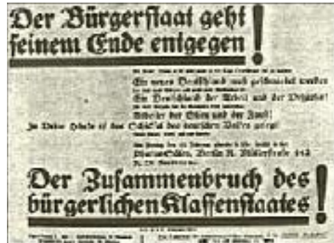
Plakat zu der Versammlungsschlacht in den Pharussälen 1

Das war allerdings eine Provokation, die man bisher in Berlin noch nicht erlebt hatte. Der Marxismus empfindet es bekanntlich schon als Anmaßung, wenn ein nationaldenkender Mensch in einem Arbeiterviertel seine Gesinnung offen zur Schau trägt. Und gar am Wedding?!