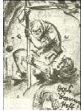
Das Banner steht! Postkarte von Mjölneur

Die eigentliche Stärke der SA. beruht darin, daß sie sich im wesentlichen aus proletarischen Elementen zusammensetzt. Diese Tatsache ist aber auch ein Unterpfand dafür, daß die SA. und damit die ganze Bewegung nie in bürgerlich-kompromißlerisches Fahrwasser abgleitet. Das proletarische Element, vor allem der SA., gibt der Bewegung immer wieder jenen ungebrochenen, revolutionären Elan, den sie sich bis auf den heutigen Tag gottlob erhalten hat. Viele Parteien und Organisationen sind seit Ende des Krieges entstanden und nach kurzem Aufstieg wieder in bürgerliche Niederungen versunken. Der Kompromiß hat sie alle verdorben. Die nationalsozialistische Bewegung besaß in der revolutionären Aktivität