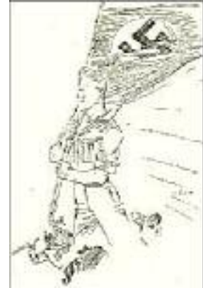
Uns kann keiner!

Den Abend dieses denkwürdigen Tages verbrachte ich bei einem alten Kampfgenossen. Ich wurde dort mit geheimnisvoller Miene zu einem Spaziergang eingeladen, von dem aus wir, ohne daß ich das als verdächtig empfand, in irgendeinem Etablissement draußen in einem Vorort Berlins landeten.