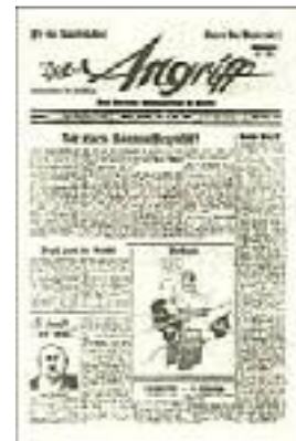
Die erste Nummer des "Angriff"

Der Leser sollte den Eindruck gewinnen, als sei der Schreiber des Leitartikels eigentlich ein Redner, der neben ihm stünde und ihn mit einfachen und zwingenden Gedankengängen zu seiner Meinung bekehren wollte. Das Ausschlaggebende war, daß dieser