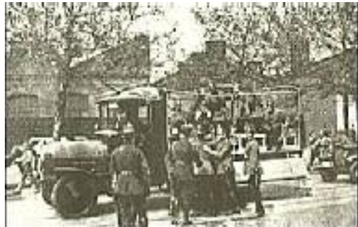
Verhaftung eines nationalsozialistischen "Schwerverbrechers"

Das Polizeipräsidium ging nun dagegen mit einer neuen Methode vor, und die war eigentlich gefährlicher als alle bisher angewandten. Bei großen politischen Zusammenstößen wurden aus irgendeinem Grunde manchmal hundert und mehr Parteigenossen zwangsgestellt und ohne Angabe von Gründen der politischen Abteilung des Polizeipräsidiums eingeliefert. Eine rechtliche Handhabe war dafür meistens nicht vorhanden. Sie wurden in großen Unterkunftsräumen zusammengepfercht und bis zum folgenden Mittag um 12 Uhr festgehalten. Dann ließ man sie laufen, ohne ihnen das Geringste anzutun.