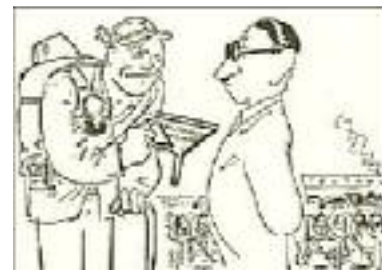
Wem Gott ein Amt gibt - - -

Der Angriff führte seinen Gegenhieb auf seine Art. Er brachte in der nächsten Nummer eine Karikatur, darauf der Berliner Polizeipräsident Dr. Bernhard Weiß in einer unnachahmlich grotesken Situation zu sehen war. Er stand da, eine große schwarze Hornbrille auf dem breiten Nasenrücken, die Hände nach hinten verschränkt, erstaunt einen SA.-Mann ansehend, der, die braune, blumengeschmückte Mütze im Nacken, mit breit grinsendem Lachen ihm gegenübertritt und einen Nürnberger Trichter entgegenhält. Die Überschrift lautete: "Wem Gott ein Amt gibt ..." Und darunter stand zu lesen: "Wir haben dem lieben Bernhard aus Nürnberg was Schönes mitgebracht."