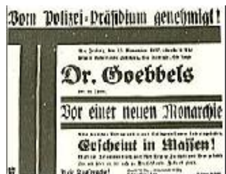
Vom Polizeipräsidium genehmigt!

Herbeigeeilt von Schraubstock und Maschine, von Kontorschemel und Fabriktsch, aus den hellen Häusern des Westens und den finsternen Höfen der