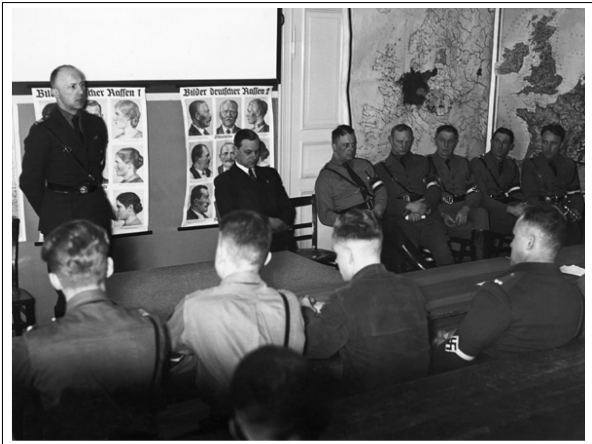
Helmut Stellrecht drži predavanje o rasnoj higijeni polaznicima škole za vođe Hitler Jugenda (Hitlerove mladeži) 1935. godine. Prvi s desna sjedi Reichsleiter Alfred Rosenberg

svijetu. Ne postoji ni jedna institucija na svijetu, ni jedna stranka ili crkva, koja ih ima pravo učiniti jednakima ili im opljačkati čak i najmanju mrvicu njihove individualnosti.