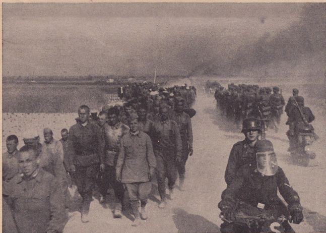
Двата свѣта се разминаватъ и отминаватъ

Злото въ Русия идѣше отъ основнитѣ грѣшки на Марксъ-Лениновата теория, както и отъ по-сетнешната практика.