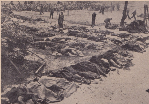
Трупове, трупове и трупове . . . . . неразрушимиятъ паметникъ на болшевишката жестокостъ

Въ своитѣ стопански отношения болшевизмътъ премахна часната собственостъ въ Ру-