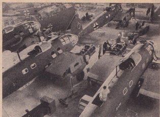
Изгледъ отъ едно монтажно отдѣление за самолети

Фактътъ, че това движение съпада съ момента, когато англичанитѣ бѣха изгонени отъ Балкана, никакъ не облекчава положението на Англия. Напротивъ, то говори, че английската империя въ всѣко отношение представлява единъ вече презрѣлъ плодъ, който е вече предъ разлагане.