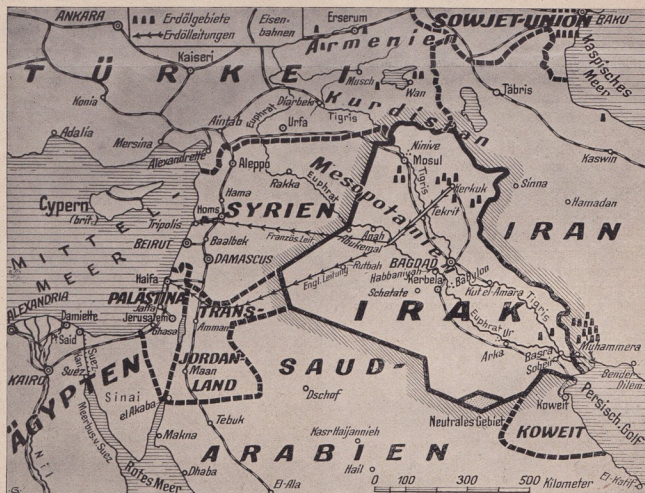
Иракъ и другитѣ арабски страни кждто пламна священата война противъ Англия

жението, което дойде вследствие англо-иракския конфликтъ и подигна цѣлия арабски свѣтъ, изглежда, че въ Форейнъ Офисъ за сега нищо друго не могатъ да кажатъ, освенъ това, че „проклетитѣ“ германци били подигнали арабитѣ противъ Англия. Тоя маниеръ да се отклонява общественото мнение отъ истинскитѣ причини за дадено положение не е новъ, тъй че не въираме вече въ свѣта да се намѣри нѣкой, който да повѣрва на тия английски методи. Най-малкото нѣма да повѣрватъ самитѣ арабски народи, че тѣ сж подбудени отъ Германия, тъй като сами най-добре знаятъ какъ бѣха измамени отъ Англия, какъ бѣха използвани и какъ бѣха зле третирани. Именно въ това направление трѣбва да се търси причината защо Великия мюфтия премѣсти своята резиденция отъ Йерусалимъ въ Багдадъ. Това бѣ само единъ символъ на неприятелско държане, което Англия зае спрѣ-