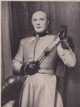
Густавъ Грюндгенсъ като кралъ Ричардъ II

войника и политика, задъ техника и занаятчията, да работимъ за общото преуспѣване и да дадемъ своя дѣлъ на родината. Когато изтощениятъ отъ грижитѣ на деня гражданинъ дойде въ театъра, то тукъ той да може да получи подкрепа, ободряване и развлечение. Артистъ е длъженъ да му ги достави. Азъ считамъ това за една голѣма и хубава задача. Най-доброто възнаграждение, което ние, артиститѣ, получаваме за своята работа, това е признателността. Ето напризмѣр, не минава день да не получавамъ отъ всички държави въ Европа писма, въ които нѣкои отъ зрителитѣ на филма „Майчина любовъ“ изказватъ своята благодарностъ и признателностъ. Тѣзи писма ме радватъ особено много, когато сж отъ наши войници, които нѣкъде въ Франция, Африка или Норвегия, сж имали възможностъ да видятъ този филмъ. Азъ се старая най-съвестно да отговарямъ на повечето отъ тѣзи писма. Можете да си представите, колко тежко и свързано съ много време е това, но азъ го върша съ такова удоволствие!“