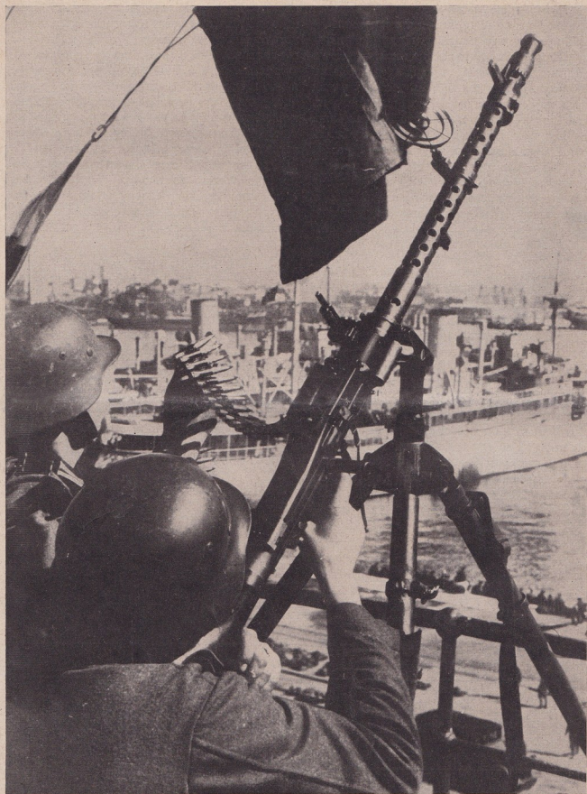
Охрана на германските транспорти през морето