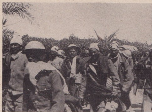
Смѣсцата отъ народи, която Англия праща на война

Впрочемъ, какъ се преценява новосъздаденото положение въ Предния изтокъ отъ американска и английска страна се вижда отъ това, че англичанитѣ и американцитѣ презглава напускатъ Мала Азия. Тѣ не биха правили това, ако почвата подъ краката имъ не бѣ станала толкова гореща, която тѣ достатъчно време грабиха като пришълци и държаха въ подтисничество единъ народъ съ значителни културни традиции.