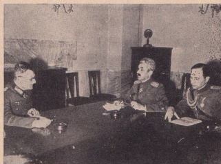
Сръбскиятъ генералъ Михай Боди подписва капитулацията на Югославияската армия предъ германския генералъ-полковникъ Вайхсъ и въ присъствието на унгарския и италианския воененъ аташета

Македония, тази люлка на българския духъ и култура презъ вѣковетѣ, следъ толкова кръвъ и страдания, е вече свободна и свободна влѣзе въ предѣлитѣ на своята майка-отечество. Съ това се слага край на кървавитѣ борби на българитѣ-македонци, чиито кървави