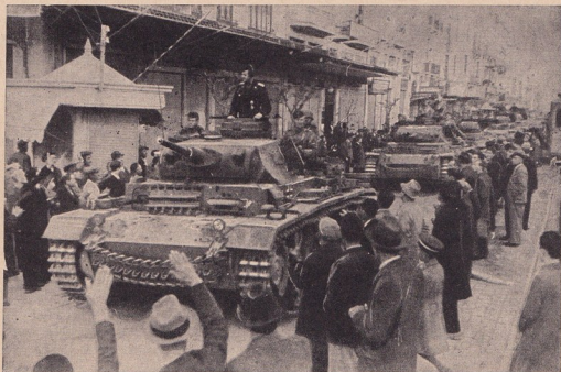
Германскитъ войски въ Солунъ

Излишно е да се подчертава, че досегашното политическо положение въ тоя край на Европа бѣше не само ненормално, но и крайно пакостно. Не България, а цѣла Срѣдна Европа бѣше лишена отъ излазъ на открито море. До сегашното грѣшко владичество надъ срѣди-земно-морскитъ и егейскитъ брѣгове, по заповѣдитъ на Лондонъ, служеше като бариера на стопанскитъ стремежи на срѣдна Европа. Тази частъ отъ Европа сега презъ България, която е давала и дава гаранции за разумно сътрудничество, безъ всѣкакво препятствие намира своето дебуще, своя отдушникъ презъ територията и морскитъ брѣгове на възродена и велика България. Хърватско и България ще бждатъ оная политическа и стопанска ось на Балкана, каквато сѣд Германия и Италия на европейския континентъ. Тия оси нѣма да