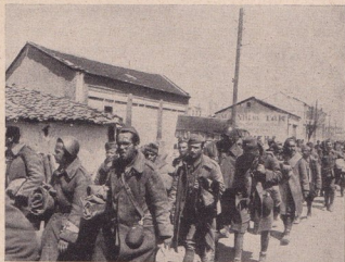
Англичани, новозеландци и гърци пленени отъ единъ отрядъ на „H“

На 25 април тази год. „Анцакъ“ празнува денъ на своето участие въ кървавата баня при Галиполи . . . Съ какво ли чувство?! Наистина човѣкъ съ право би си задалъ този въпросъ. Може би живите днесъ отъ състава на „Анцакъ“ да нѣматъ твърде вѣрна представа за онова време, за да разбератъ, че той денъ не може да бжде денъ на военна гордостъ.