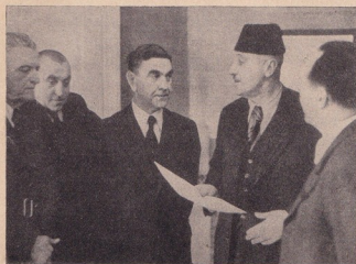
Държавниятъ глава на новата хърватска държава д-ръ Анте Панеличъ се съвещава за образуването на първото хърватско правителство

Помощитѣ отпуснати за другитѣ градове и села сѣ, разбира се, по-малки отколкото тия, които се плащатъ въ столицитѣ. Все пакъ и това положение въ Германия е по-благоприятно, отколкото въ другитѣ страни.