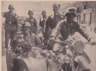
Германски войски въ Атина

Тамъ при Галиполи не бѣ поле на военни добродетели. Тамъ стърчи мрачния паметникъ на „военния гений“ на Чърчилъ, чиято глупостъ бѣ изкупена съ цената на хиляди човѣшки живота.