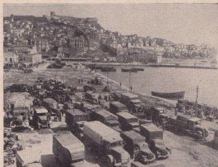
Германскитѣ войски въ Кавала

И тогава, както и сега, Чърчилъ хвърли въ една необмислена авантюра австралийския корпусъ „Анцакъ“, който имаше за задача да прикрива отстъплението на английскитѣ войски и по тоя начинъ го жертвува почти изцѣло. Австралийцитѣ и новозеландцитѣ трѣбваше да извършатъ десантъ съ лѣвото крило при Кабарепе и Ари Бурунъ. Австралийскитъ генералъ Бирвуодъ ръководѣше акцията на „Анцакъ“. Въ нощта на 25 априлъ отрядъ отъ австралийцитѣ се появи въ устието на Зингиндеръ и въ 4 часа сутринта първитѣ лодки се приближиха до сушата. Турската артилерия веднага откри огънь срещу тѣхъ. Австралийцитѣ натъкнаха ножоветѣ и стѣпиха на земята. Тѣ се покатериха по брѣга. Три английски бронирани кораби закриляха десанта, но огънятъ на турската артилерия сѣеше смъртъ всрѣдъ госто движениитѣ се маси отъ австралийци. Последва една турска контра-атака на ноевъ, а следъ това единъ унищожителенъ шрапнеленъ огънь се изсипа надъ главитѣ на разколебанитѣ новозеландци и австралийци. Но генералъ Бирвуодъ имаше заповѣдъ, при каквито и да е обстоятелства, да се задържи. Хвърлени бѣха нови австра-