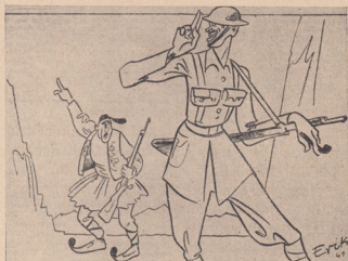
Гъркътъ: Германцитѣ идатъ! Англичанинътъ: — Олъ райтъ! . . .

Обстоятелството, че Англия все пакъ разпространява легендата за голѣмитѣ германски загуби доказва най-добре, колко малко Англия е разбрала отъ германскитѣ бойни методи.