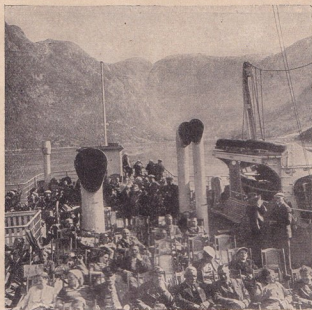
Работниците въру борда на парахода „Крафтс дурх Фройде“ правят своите излети

грижа на държавното ржководство да формира свободното време на трудящите се и да го насочи към такова оползотворяване, щото да се даде възможността на германското работничество да вземе участие въ културните блага на нацията. Отъ 1933 год. насамъ това става чрезъ германската националъ-социалистическа общность „Сила чрезъ радост“.