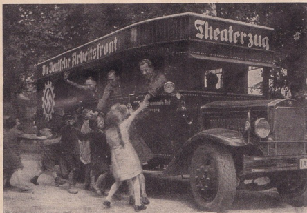
Пътуващ театър за работниците

Днес, обаче, германският работник знае, че неговият труд е основата за образоването на всички национални блага от материален и културен вид. Вследствие на това ново отношение към труда и към свободното време, работникът дойде до съзнанието, че той освен своето собствено благо, твори и благо на своите сънародници, другари и пр. В Германия всички работници сж едновременно и творци и другари по между си. Целокупната производителност на това огромно другарство идва като добре дошла за целите на народната общност. Към всичко това, остава само като една съществена