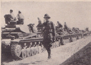
Част от дивизията-призрак в Африка

своя марш. Като че ли цѣлния бѣ излѣн отъ стомана, когато въ ония епични боеве, той издаваше своитѣ команди ту на нѣмски, ту на френски езикъ — единъ пѣтъ на нѣмски — за своитѣ войници, а после на френски, за да го разбератъ добре и самитѣ противници, които така често оставаха задъ него слисани, убъркани и дезорганизирани. Неговиятъ командуща танкъ се движеше все напредъ и напредъ до като въ решителния день отъ борбата бѣше проникналъ въ срѣдата на разбититѣ французки колонии и се намираше на 60 км. задъ укрепената линия Мажино, въ нейното протежение задъ Белгия. Това е образътъ на младия генералъ, когото го смѣтатъ още дори за младежъ, защото той нѣма още 50 години, а и външниятъ му видъ го прави много помладъ. Това е образътъ на онзи генералъ, който сега застави англичанитѣ въ паническо бѣгство да освободятъ придобититѣ съ толкова жертви области и да потърсятъ спасяване само въ едно бѣгство, ако може въобще да става дума за спасяване чрезъ бѣгство предъ