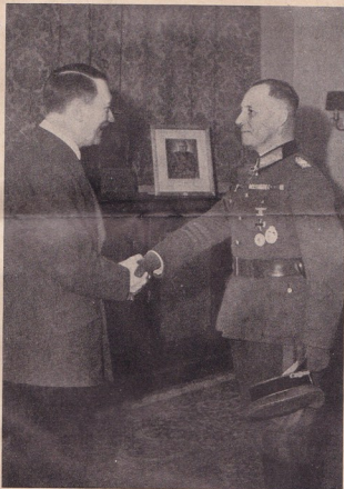
Генералъ Ромелъ при водача

Въ действителностъ личността на този генералъ съ право може да претендира да бжде обектъ на едно особено внимание въ свѣтовния печатъ, защото предъ Бенгази доказа, че разбира добре своя воененъ занаятъ. Впрочемъ това той доказа още по време на боеветѣ