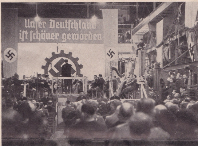
Германски работници през свободното си време присъствуват на концерта

ботниците. Дори Вагнеровият вестифалт въ Байрот тази година бѣ даденъ изключително само за работниците и войниците. Милиони германски работници по тоя начинъ имаха възможността да се запознаятъ съ творбите на най-добрите германски артисти въ тоналното изкуство.