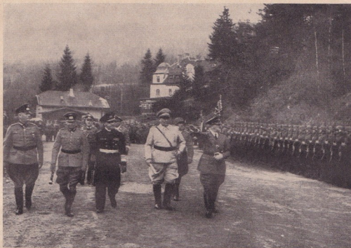
Рождения ден на Фюрера

на социалистическите вестници, господството на евреите и пр. не го оставили да се чувствава приятно въ града на Хабсбургите. Той още тогава става антимакист, антисемит и антипарламентарист. След като живял няколко години като чужд на Виена, една вечер решава да замине за Мюнхен. Съ малко багаж и без пари той преминал от другата страна, границата съ Германия. Именно това решение е трябвало да бъде от решително значение както за неговия живот, така и за историята на германския народъ.