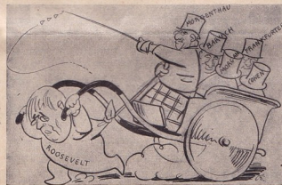
Въ сжщность той е това

Все пакъ Рузвелтъ може да протръка рѣцетѣ си отъ удоволствие: неговата балканска