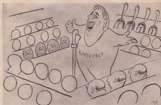
Рузвелтъ си въобразява, че всичко нарежда

богове Мидасъ си предложилъ услугитѣ за арбитъръ. Съблазнителнитѣ тонове отъ флейтата на Панъ така му се харесали, че Аполонъ, съ своятъ цитра му изглеждалъ като единъ беденъ тръбачъ. Разбира се, това е било една толкова погрѣшна преценка, щото ускърениятъ Аполонъ едва се е сдържалъ да не набие нетактичния арбитъръ, а само го оставилъ да