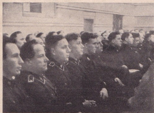
Часть отъ публиката

Това оформяване и използване на работното време при работника ще продължава и за въ бжде и все повече и повече ще бжде насърчавано до тогава, до като този работникъ най-сетне каже: най-после азъ принадлежа къмъ всичко онова, което е резултатъ отъ труда на моитѣ съотечественици и азъ съмъ единъ равноправенъ членъ на другарството верѣтъ цѣлата нация.